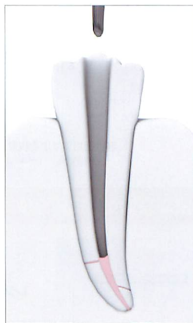
スーパーエンド アルファ2を引き抜き、ハンドプラグを用いて、根管を整えます。