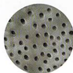
Treated with SmartLite Pro EndoActivator

柔軟性の高いノンカッティング 樹脂素材を採用し、レジンや トランスポーターション、 根管壁を傷つけることはありません。