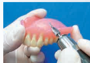
義歯辺縁部の削合